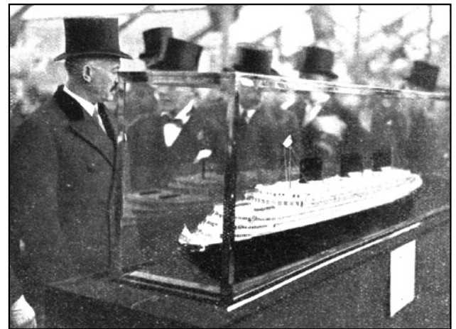
le président Albert LEBRUN découvrant la maquette du Normandie