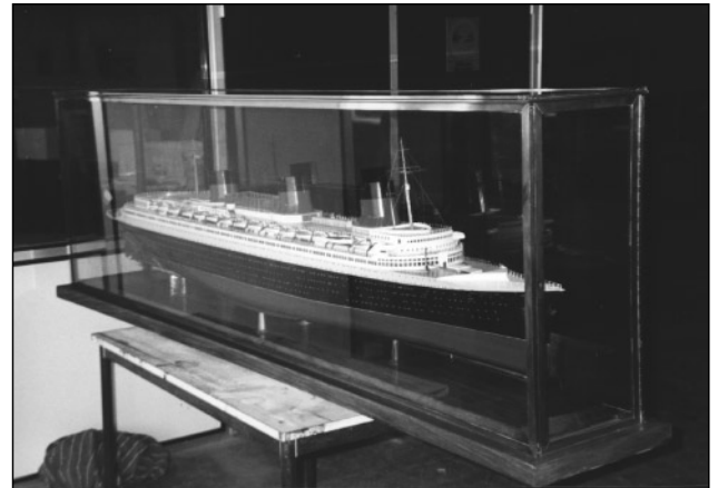
Maquette du Normandie

L'Association French Lines a présenté un stand puisque que le thème de cette année est le suivant «Le Havre, d'un port militaire à un port de commerce». Notre Association a pu répondre aux nombreuses questions qui n'ont pas manqué d'être posées par les étudiants havrais intéressés par le sujet. Le but de l'Association est d'inviter un certain nombre d'étudiants à venir effectuer leurs recherches (pour d'éventuelles études universitaires) dans notre centre de consultation.