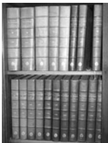
Tableaux du commerce de la France

Encore une fois nous souhaitons remercier la direction d'Armateurs de France pour son initiative et l'équipe qui a tout fait pour que le dépôt se fasse dans les meilleures conditions. Les livres ont même gardé leur