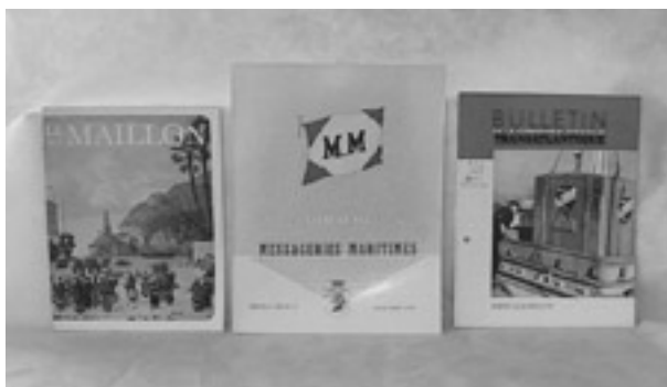
« Le Maillon » ; « Courrier des Messageries » ; « Bulletin de la Compagnie Générale Transatlantique »

Notre fonds comprend de nombreux périodiques relatifs au monde maritime tel que Le journal de la marine marchande dont nous possédons une collection complète depuis 1932 jusqu'à nos jours mais aussi les numéros des années 1893, 1894, 1897, 1899, 1900 et 1901. Bien évidemment, vous pouvez consulter les revues émanant de la Compagnie des Messageries Maritimes et de la Compagnie Générale Transatlantique comme le Courrier des Messageries ou le Bulletin de la Compagnie Générale Transatlantique mais aussi les premiers numéros de la revue Le Maillon