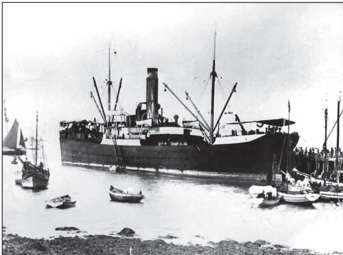
Le paquebot Volga. Paquebot en fer à une hélice, lancé à la Ciotat le 21 novembre 1864. Il est vendu le 8 juin 1894 à la Compagnie China Marchants à Saigon.

La navigation du Tonkin, ne ressemble en rien à celle de Manille. on longe en effet la côte à 2-3 milles en moyenne, en sorte qu'on a sous les yeux un spectacle qui varie continuellement. Je me suis amusé à prendre en croquis les profils des montagnes devant lesquelles nous passons afin de savoir reconnaître le pays au prochain voyage. Le Commandant m'a dit de faire ce petit travail sur la passerelle et m'a prié de lui en remettre une copie, car les cartes de ces côtes sont très mal faites. En mer, j'ai donc passé presque tout mon temps sur la passerelle. le premier point où l'on s'arrête, après Saigon, est Nia Trang. Il faut vingt-