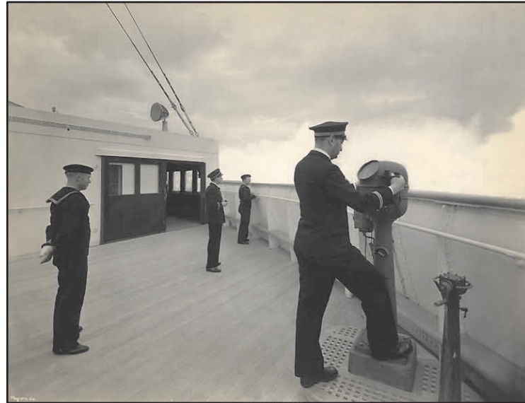
passerelle de navigation à bord du Normandie.

En parallèle à la description des différents postes, une partie thématique est dédiée à divers aspect de l'histoire maritime comme par exemple la « thématique navigation » qui s'attache à décrire différents aspects pratiques de la navigation; de la construction d'un navire à son activité en mer.