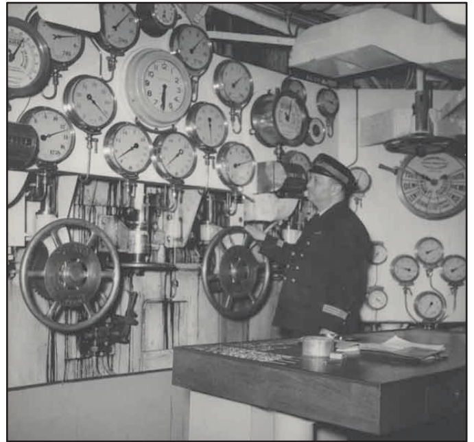
chéf mécanicien sur le De Grasse.