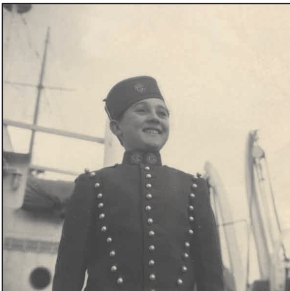
mousse à bord du De Grasse en 1947.

Nous avons donc souhaité, au moyen de notre site internet et afin d'intéresser le plus grand nombre de visiteurs, quel que soit leurs profils, rendre hommage à cette histoire des métiers