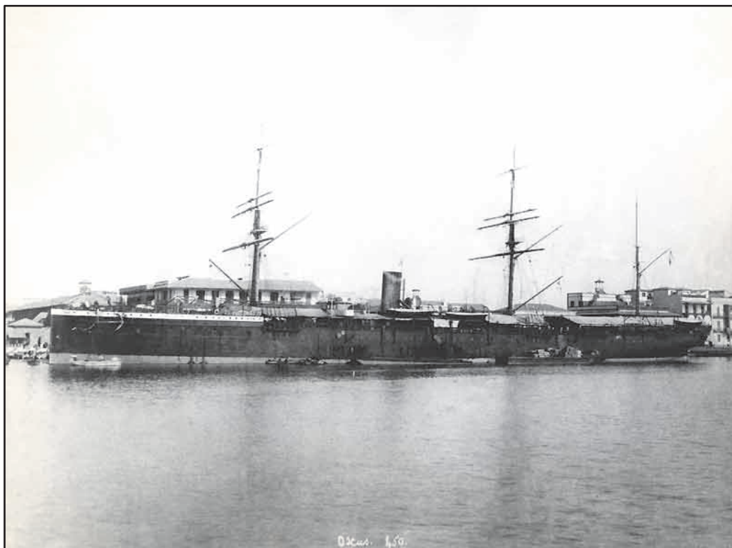
Paquebot Oxus Lancé à la Ciotat le 27 avril 1879. Sabordé à Novorossiisk le 21 juin 1918.

Arrivé à Saigon, le 18 octobre et affecté à la ligne Saigon-Manille, Yersin confie ses impressions premières (Lettre du 20 octobre) :