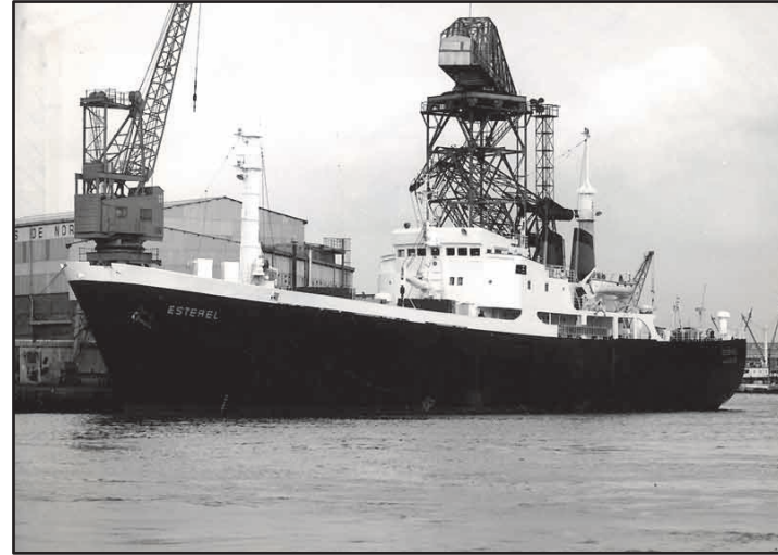
Esterel, CGT 1967-1969.

L'Association French Lines tient à les remercier chaleureusement pour le travail qu'elles ont effectué.