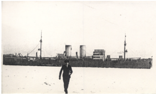
▲ ATLANTIS, sous l'un de ses déguisements en Baltique, pris par les glaces pendant ses essais

Avec l'équipage du COMMISSAIRE RAMEL (dont des Français 1 ) le nombre des marins alliés prisonniers à bord de l'ATLANTIS atteint environ 260 qui, ajouté aux 350 marins allemands de l'équipage, représente plus de 600 personnes à bord. Cela pose des problèmes au capitaine de vaisseau Rogge, Commandant de l'ATLANTIS, pour assurer le ravitaillement en vivres et eau, le logement et la surveillance des prisonniers.