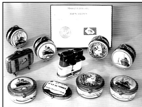
Boîtes en porcelaine

Ateliers d'Art Ribierre, 3 rue Thomas Edison 87220 FEYTIAT (Tél. 05 55 31 34 74).