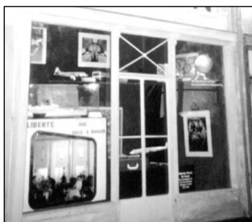
Vitrine French Lines : exposition «La machine à rêver»

L'exposition «La machine à rêver», préparée par la Ville du Havre, s'est déroulée à l'Hôtel de Ville du 3 décembre au 29 février. Cette très belle exposition regroupait des objets et inventions qui ont marqué le siècle, en s'imposant dans notre vie de tous les jours, ou par leur caractère historique. A cette occasion, L'Association a prêté quelques objets témoignant, entre autre, de l'importance des traversées transatlantiques.