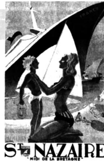
L'affiche du France d'Emile-Louis Guillaume et la silhouette de France dans un contexte balnéaire (1962).

De l'entrée sud de l'usine élévatoire, le parcours présente les ouvrages, les techniques et les métiers portuaires permettant d'accéder dans le port. Un accès au bâtiment de l'ancienne usine élévatoire ajoute une note d'exception à cette visite. Parcours commenté à pied de