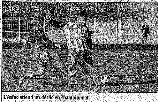
L'Asfac attend un déclin en championnat.

Les Lattois, que l'on donnait outsiders au vu des deux derniers exercices où ils avaient joué le titre et même le barrage pour l'accession, sont loin d'avoir convaincus. Ils ont même fortement déçu