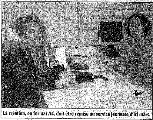
La création, en format A4, doit être remise au service jeunesse d'ici mars.

Le service Jeunesse cherche son logo : avis aux dessinateurs