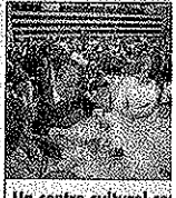
Un centre culturel co