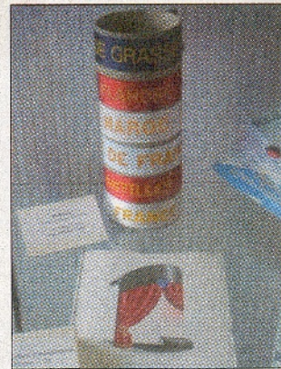
Les rubans et les menus sont parmi les petits objets les plus courus.

L'objectif de cette vente annuelle est de gagner l'argent qui permettra à l'association de continuer à entretenir l'exceptionnel patrimoine conservé tel que les boiseries du France 1912 . Pour que la mémoire de la Compagnie Transatlantique ne s'efface jamais.