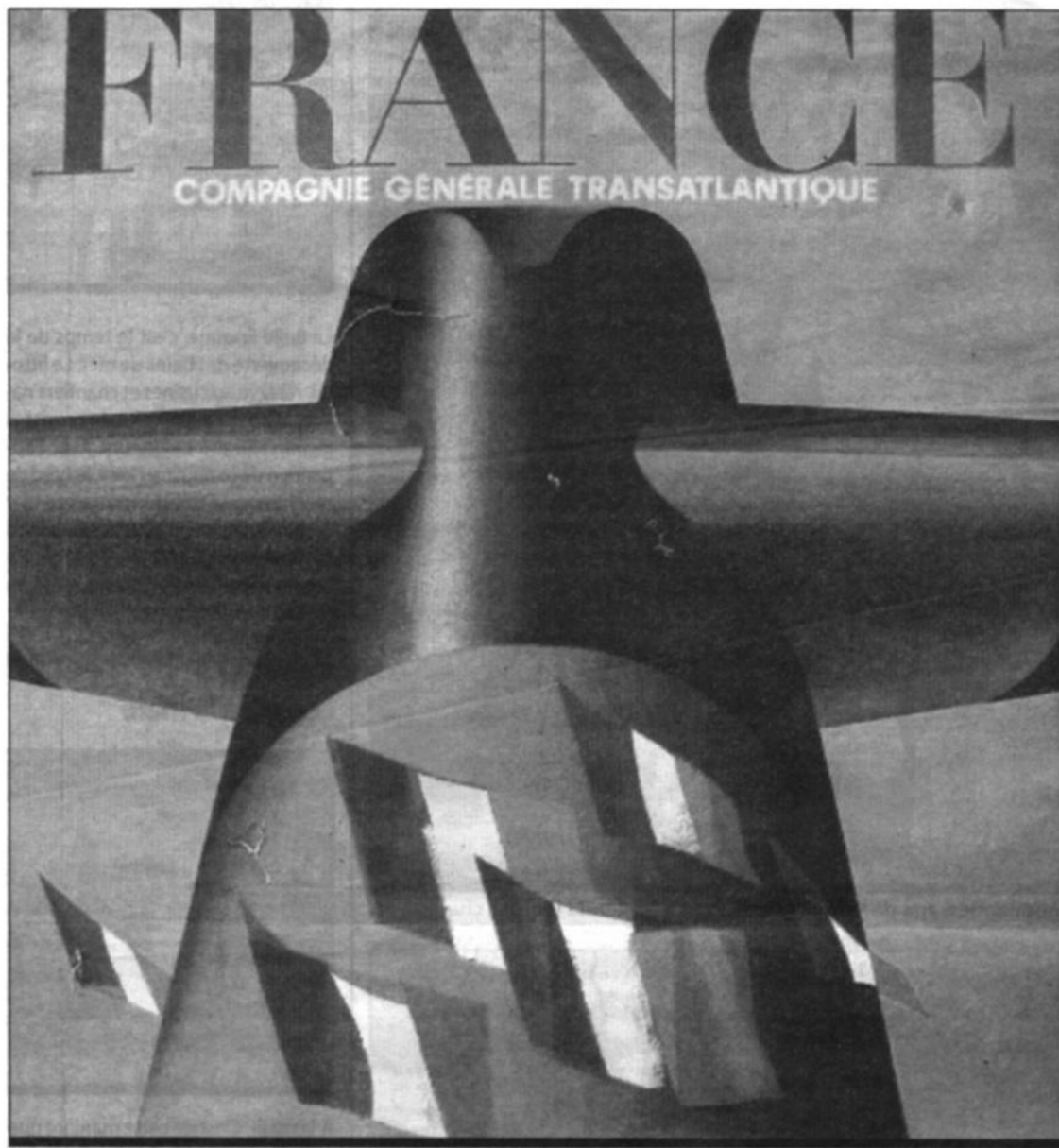
L'original d'un projet d'affiche de Nathan (gouache sur papier, 1962)

Le paquebot France. Il reste dans la mémoire collective un souvenir fort et chargé d'émotion pour les Havrais. Il faisait les liaisons jusqu'à New York, à partir du port de la Porte océane pendant de nombreuses années (lire ci-dessous). C'est pour rendre hommage à cette glorieuse époque qu'une exposition sur le dernier des grands paquebots français intitulée « Paquebot France » sera présentée en 2012 au Havre, et entre février 2011 et août 2013 dans divers sites, comme Paris, Roubaix ou encore Marseille.