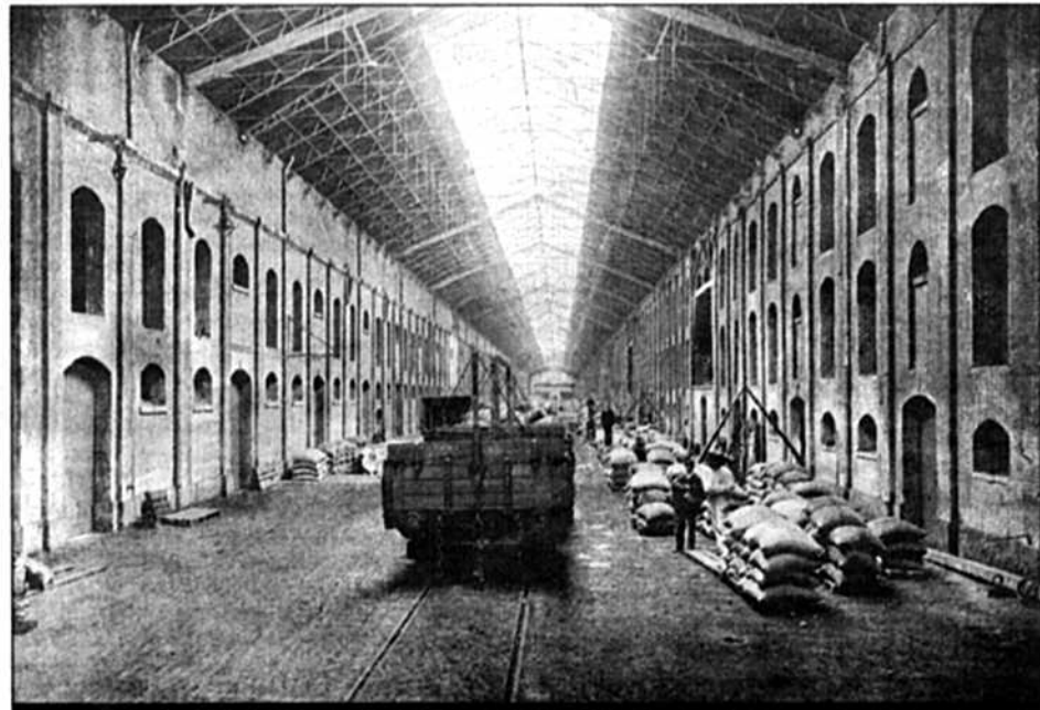
Les docks Café à la veille de la Première Guerre mondiale

Les deux premières parutions ont remporté déjà un franc succès et ce tome 3 était attendu.