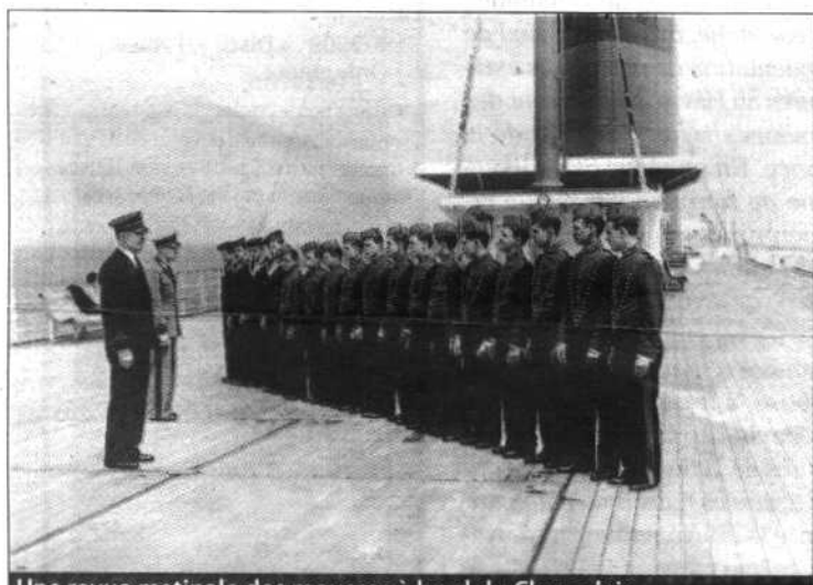
Une revue matinale des mousses à bord du Champlain

La discipline sur un navire a toujours été un élément important. Sur un bateau, le règlement est fixé afin de définir les fonctions de chacun. Voici le récit d'un commandant (1953 à 2000 à la CGT puis à la CGM) recueilli par l'association French Lines : « Il y avait quand même un minimum à respecter. Il y a un code disciplinaire et pénal de la marine marchande. Il y avait aussi la peau de bouc. Au cours de ma carrière, j'ai dû mettre une fois quelqu'un sur la peau de bouc. Il avait dépassé plus que largement les bornes. Quand il n'était pas de service, il faisait ce qu'il voulait. Il y avait donc des règles dans la mesure où on vivait en communauté, un minimum de règles était à respecter pour ne pas nuire aux autres. Le tapage nocturne par exemple n'était vraiment pas apprécié... »