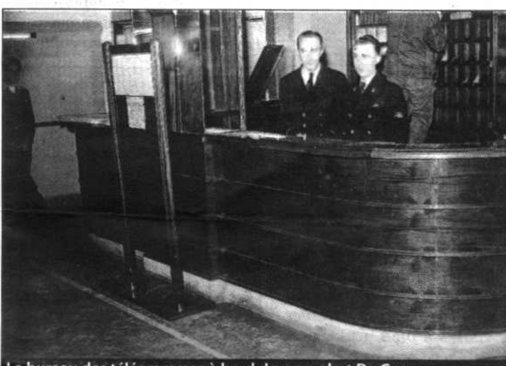
Le bureau des télégrammes à bord du paquebot De Grasse