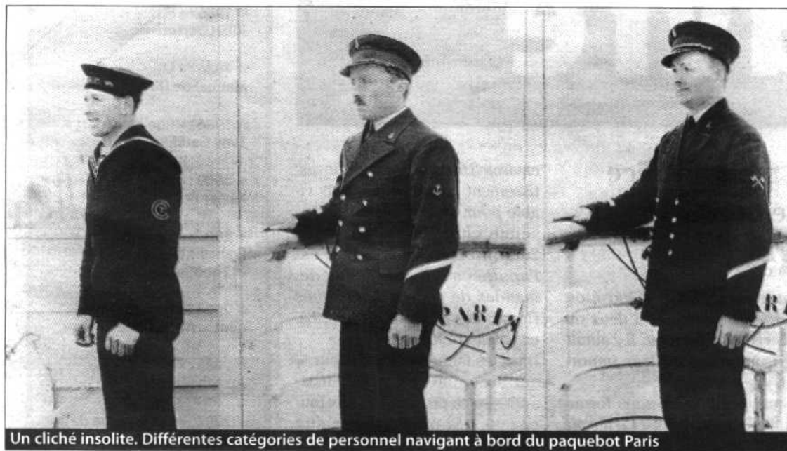
Un cliché insolite. Différentes catégories de personnel navigant à bord du paquebot Paris