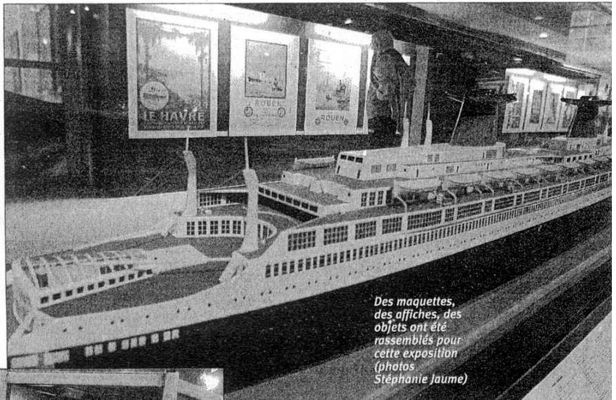
Des maquettes, des affiches, des objets ont été rassemblés pour cette exposition