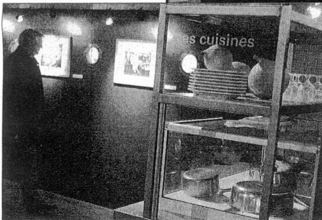
Bienvenue à bord nous permet aussi de découvrir les coulisses des paquebots et notamment les cuisines. Sur le France , 180 personnes travaillaient en cuisine