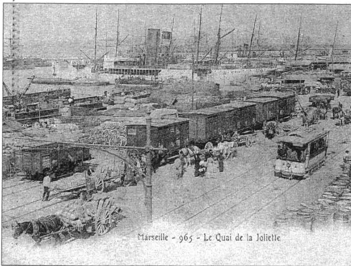
Le port de Marseille vers 1890

L'hôtel de ville abrite jusqu'à la fin du mois un voyage au fil des archives de la Compagnie générale Transatlantique et des Messageries maritimes. Larguez les amarres.