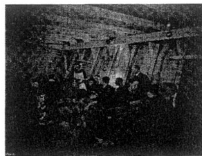
Byron : quartier de l'équipage à bord du paquebot Normandie, photographie