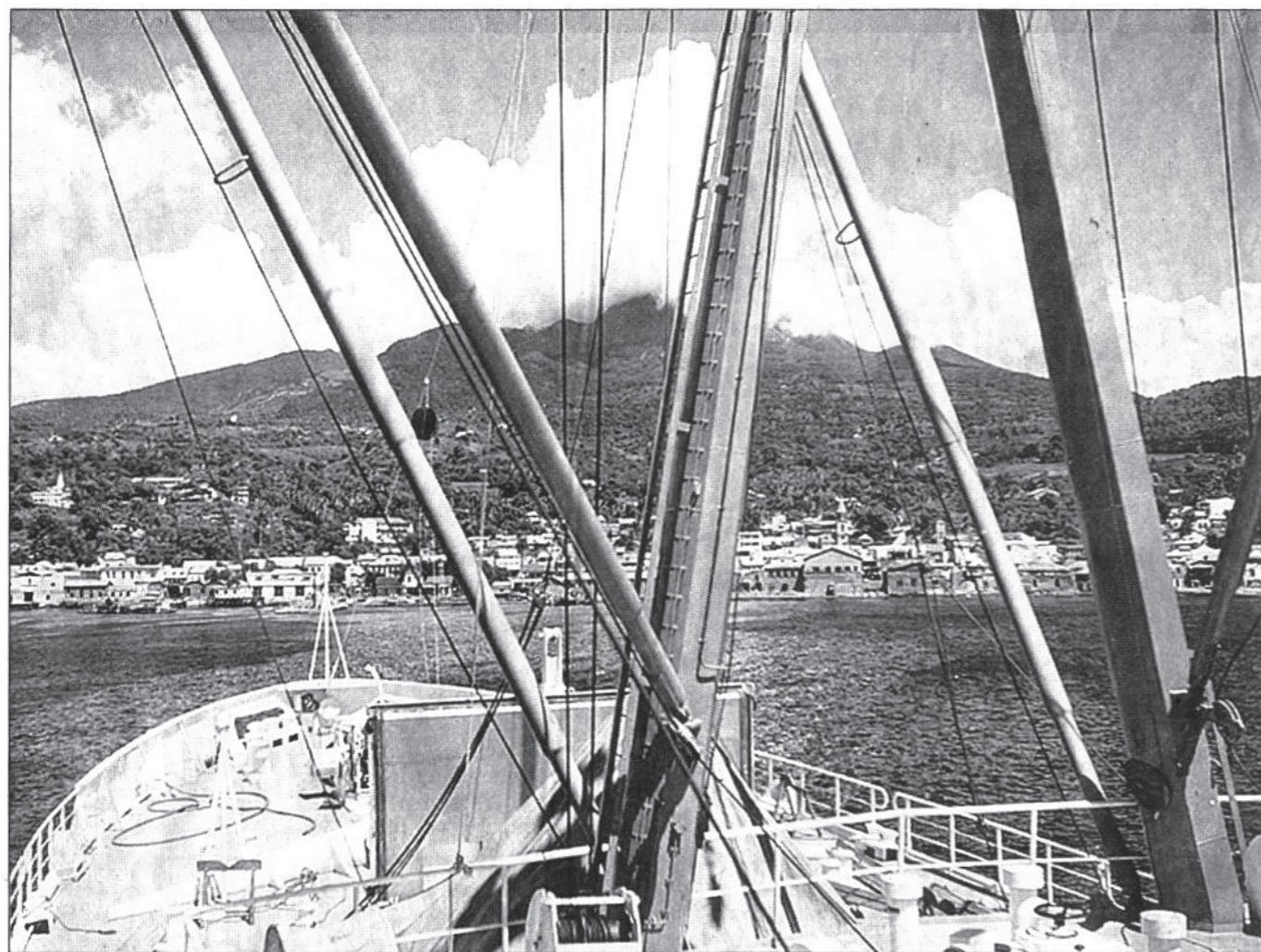
Destination Antilles : chaque escale en Martinique et en Guadeloupe rythme la vie de l'archipel français

En 2003, Dunkerque a ainsi reçu près de 400 000 tonnes de bananes dont 370 000 en provenance des Antilles. Pour la même année, le port du Havre n'avait reçu que 936 tonnes.