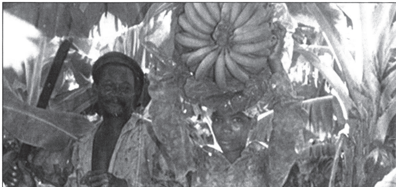
Avant la conteneurisation, la banane était conditionnée dans des cartons, mais la cueillette reste la même