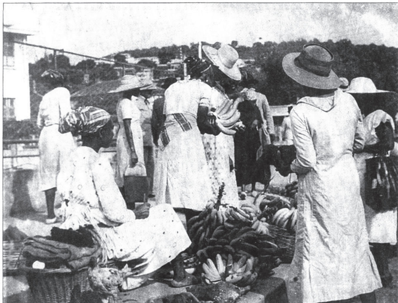
Pendant des décennies, la Transat a été le transporteur exclusif de la banane à destination de la métropole