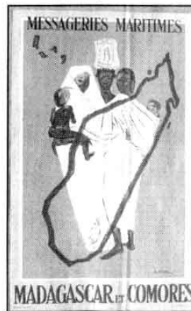
Une affiche originale particulièrement rare