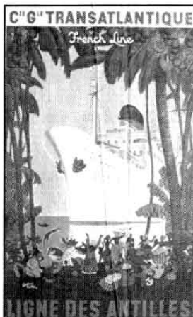
Les affiches de la Compagnie Générale Transatlantique sont estimées entre 50 et 150 euros

Une autre partie du patrimoine est mis à la vente à l'occasion de ventes exceptionnelles une fois par an. L'une d'elle se déroule cette semaine au Havre dans les locaux de la structure associative. « Une vente a déjà été organisée à Marseille la semaine dernière. Deux autres sont prévues le 16 décembre, l'une à Dunkerque, l'autre à Paris. Nous sommes chargés de les organiser car tous les objets répertoriés partent d'ici. » Un travail minutieux qui a demandé deux mois de labeur. Les collectionneurs et les nostalgiques des grands paquebots français peuvent y dénicher des objets d'époque provenant de la flottille de la Compagnie Générale Transatlantique et des Messageries Maritimes. Médailles inaugurales, illustrations, affiches promotionnelles ou encore menus et livres sont ainsi vendus. Il s'agit d'un mélange d'originaux et de produits dérivés plus récents comme cette