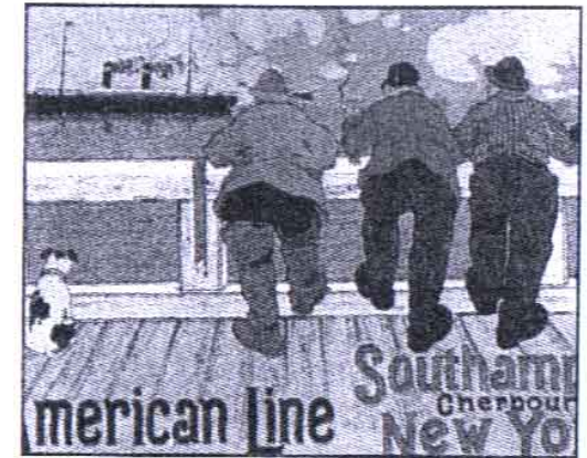
De nombreux documents (photographies, lithographies, reproductions d'actes officiels) ainsi qu'une multitude de maquettes et d'objets de toutes natures ont été réunis dans le cadre de l'exposition "Quand les paquebots avaient des voiles, les origines de la ligne Le Havre - New York". PAGE 5