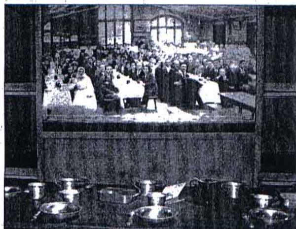
Des images d'archives de la French Lines, sont en lien direct avec certains espaces d'Escal'Atlantic comme ici l'entrepont des émigrants

Cette présentation très documentée est complétée par un espace de 200 m 2 sur lequel