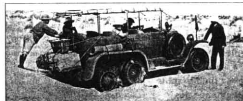
Cette auto 6 roues — ici en photo dans les dunes entre Tozeur et El Oued — est présentée en maquette à l'occasion de l'exposition.