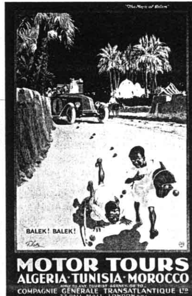
Motor Tours, affiche de 1925 variant les destinations alors en vogue : Algérie, Tunisie et Maroc. Roberts