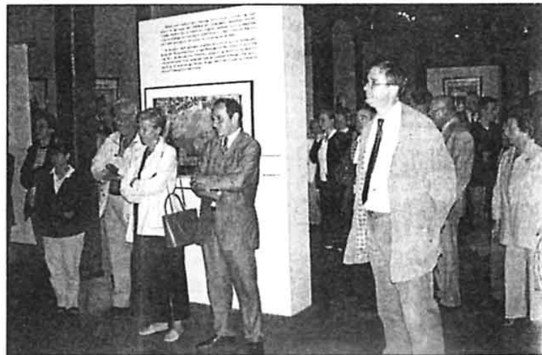
Une foule de visiteurs passionnés, présents lors du vernissage.