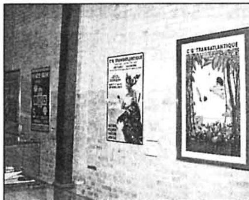
Un trésor iconographique.

Elle s'est fixée pour objectif de présenter au public ses collections dans des lieux d'exposition temporaire tant en France qu'à l'étranger, et de rendre accessibles ses archives dans des centres de documentation dans les principaux ports français où s'est déroulée l'histoire de ces compagnies.