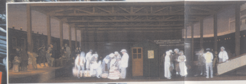
Le départ d'émigrants vers l'Amérique : une mise en scène virtuelle rendue possible grâce au théâtre optique Virtex TM.