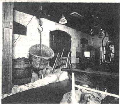
Le musée est également un espace de mémoire pour la marine en bois.

Espace maritime et portuaire, Docks Vauban, quai Frissard, Le Havre. Ouvert le dimanche, lundi et mercredi de 14h30 à 18 heures. Pour les groupes avec visite-conférence: visite possible tous les jours, sur réservation (obligatoire). Tél 02.35.24.51.00. Fax: 02.35.26.76.69.