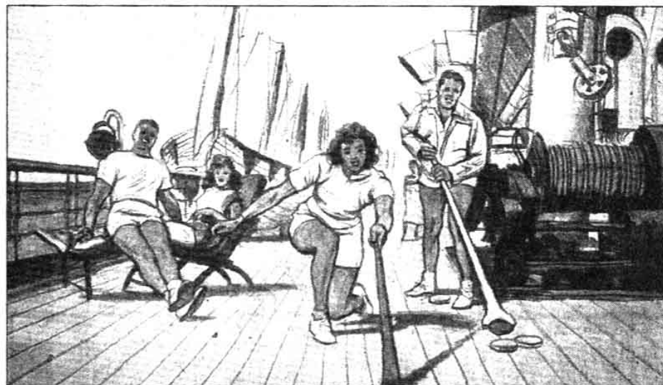
L'un des magnifiques fusains malheureusement non signés sur la vie à bord de Liberté

Exposition « Trésors au long cours », palmeraie de l'Hôtel de Ville, ouverte tous les jours jusqu'au 15 septembre. Entrée gratuite.