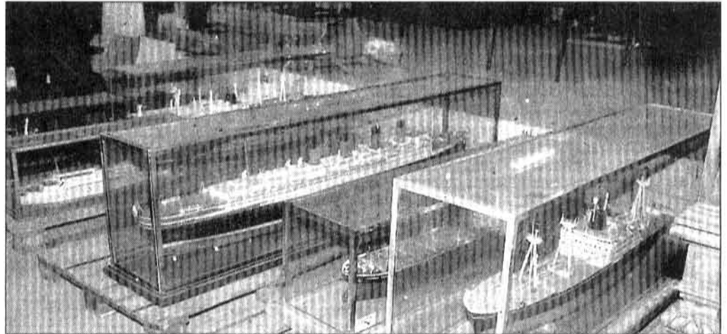
Plus de 60 maquettes de paquebots et de cargos ont été récupérées.

Reste les objets. Outre les maquettes, l'argenterie et les centaines d'affiches originales, les pièces de l'équipement intérieur des navires demeurent les